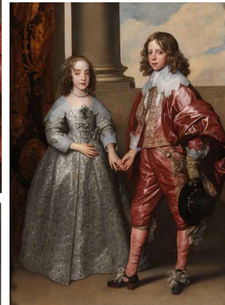
Anthony van Dyck, Willem II en zijn bruid Maria Stuart , 1641, olieverf op doek, Rijksmuseum Amsterdam