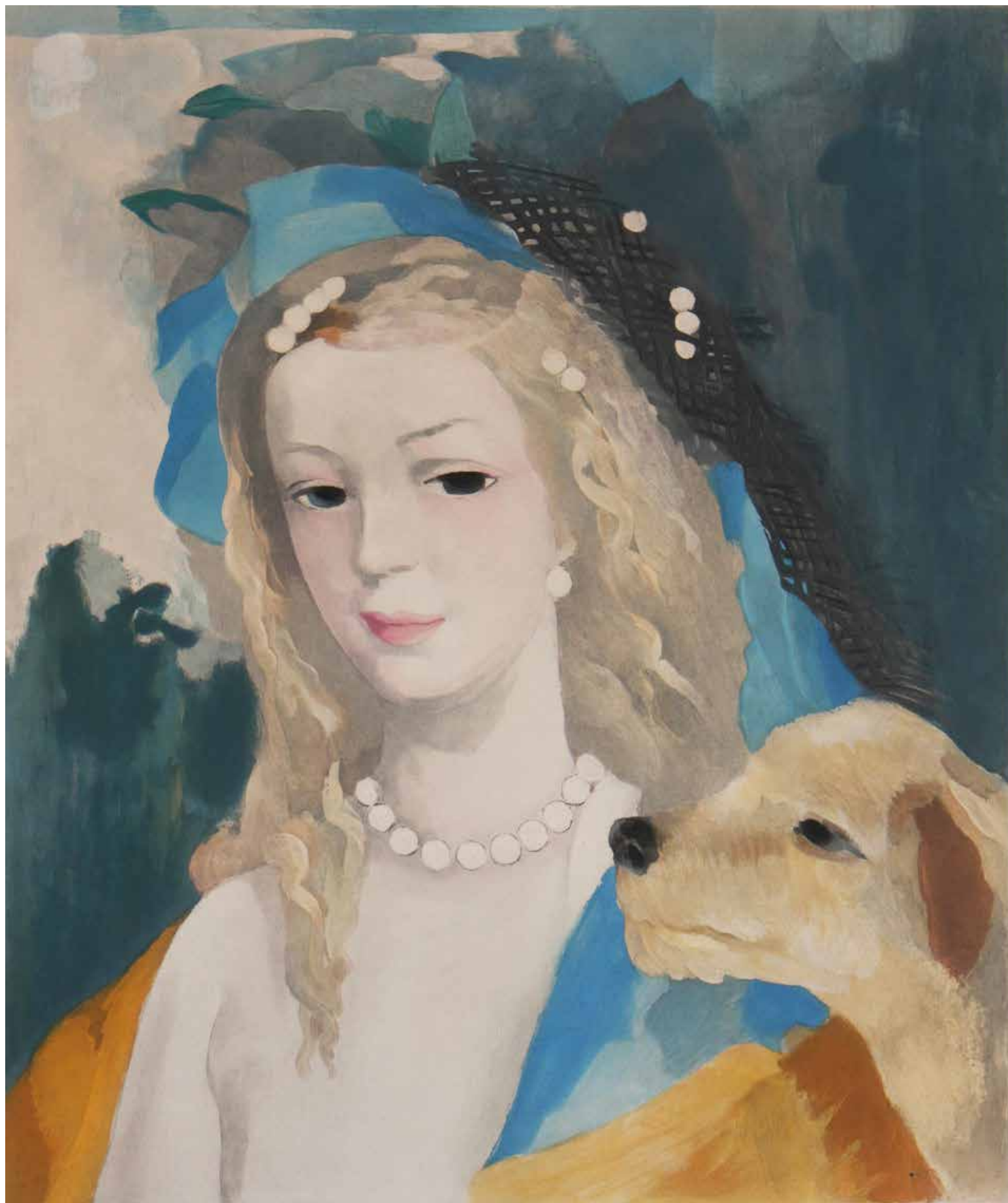
Marie Laurencin, Jeune Fille avec Chien , ca. 1950 hr