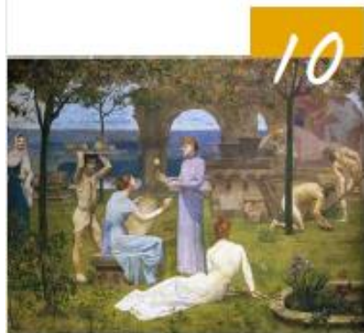
10 PIERRE PUVIS DE CHAVANNES PARADYSELIJKE SCHOONHEID