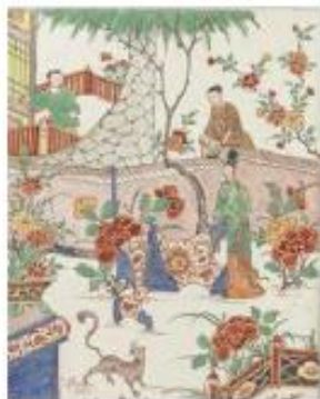
34 CHINESE TUIJNEN DE WERELD IN HET KLEIN

Foto omslag: Emil Nolde, Blumenstillleben mit roten und gelben Blüten, 1900/05, aquarel op Japanse papier, 32,2 x 46,6 cm.