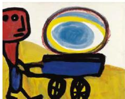
Karel Appel, Mannetje met de zon , 1947, Collectie Stedelijk Museum Schiedam, aankoop Pierre Janssen

Wat kunnen mensen nu nog van hem leren? Hoe actueel is Pierre Janssen (1926 – 2007) voor iemand die kunst maakt en van kunst houdt? Heel veel, luidt het antwoord. Janssen was zijn tijd ver vooruit. Hij liet je echt kijken en sprak in gewone mensentaal. In een tijd waarin kunsthistorici meestal in ‘moeilijke’ woorden uitlegden ‘hoe het zat’ was dat bijna revolutionair.