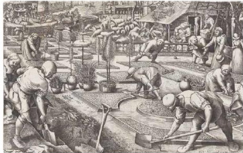
Mijnke Buskens: 'De tuin', 2012, 100 x 100 cm, potlood op papier met goud.