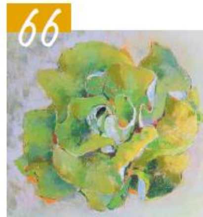
66 EEN KROP SLA IN PASTEL

44 MYNKE BUSKENS TEKENEN, TIPS EN TECHNIEK